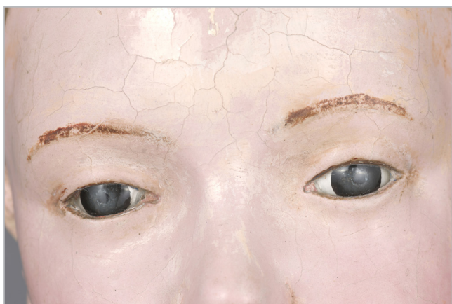
Figura 5.- Ojos dispuestos mediante la técnica de la mascarilla en la cabeza.

aproximaciones, entendiendo, en cualquier caso, que su estado históricamente auténtico es su estado presente (Muñoz 2004: 88).