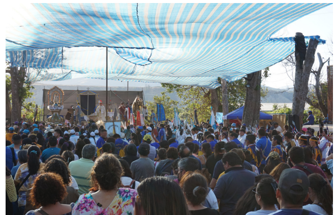
Figura 9.- Celebración litúrgica en honor al Niño milagroso en El Paltal.

misas y se prenden velas [Figura 9]. Estas escenas se repiten durante varios días, mientras se pagan las mandas en honor al milagroso. Todos estos dones son para agradecer a la imagen, mantenerla contenta y que devuelva con buenas cosechas, buena salud, sanación de enfermedades y abundancia de trabajo. Hay personas que peregrinan hasta Sotaquí para hacer mandas para el año siguiente, pero hay otras que retornan a devolver las mandas hechas al Niño por los milagros por él concedidos. Incluso en prensa pueden encontrarse referencias a personas que habrían sanado mediante mandas ( Diario La Provincia 1952).