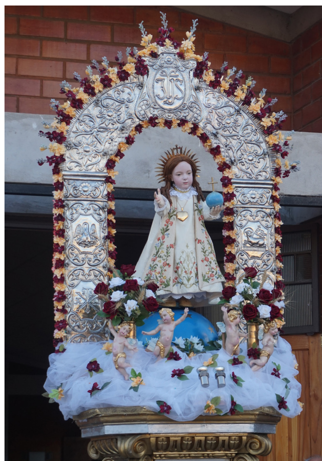
Figura 2.- Imagen del "Niño Dios de Sotaquí" después de su restauración, vestido y con sus atributos característicos, sobre un anda ubicada en la entrada del salón parroquial, tras haber sido descendido de su altar, durante la liturgia previa a una procesión (Fotografía: Carmen Royo Fraguas, Archivo CNCR).