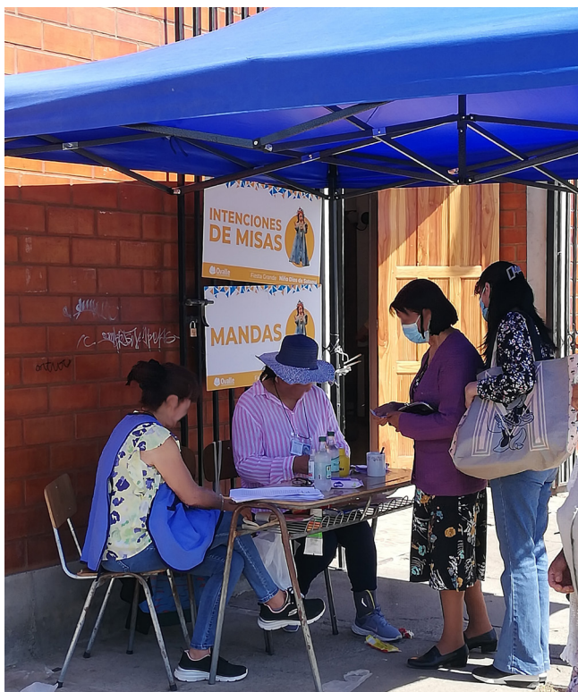
Figura 10.- Entrada del salón parroquial habilitada como zona para mandas e intenciones de misa por parte de la comunidad feligresa.