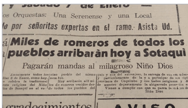
Figura 8.- Noticia del Diario La Provincia, 7 de enero de 1950.

En su Fiesta Grande, la comunidad sotaquina hace descender la imagen de su altar para sacarla en procesión sobre andas que lo trasladan hasta El Paltal, al hombro de personas voluntarias y rodeado de los bailes religiosos tradicionales del norte chileno. El Paltal es un terreno aledaño donde los bailes saludan a la imagen, se ofrecen