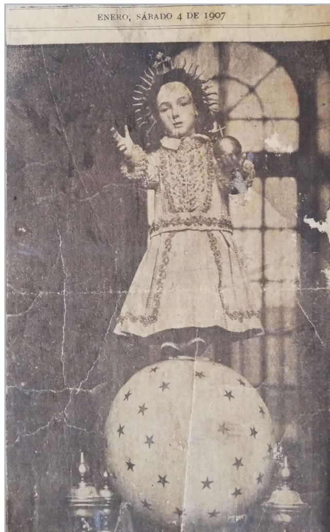
Figura 4.- Imagen del "Niño Dios de Sotaquí", 4 de enero de 1907 (Fotografía: Archivo parroquial de Sotaquí).