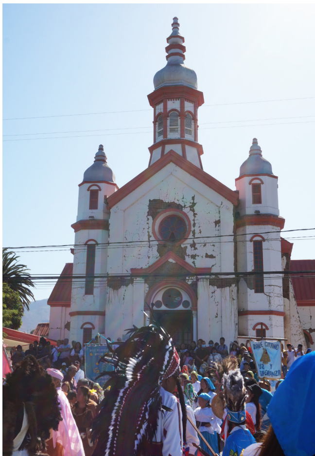
Figura 1.- Parroquia Santuario del Niño Dios de Sotaquí durante la Fiesta Grande de enero del año 2023.

Por aquel entonces, el CNCR participaba en un proyecto dirigido por la investigadora responsable en la Pontificia Universidad Católica de Chile, cuyo objetivo era el estudio