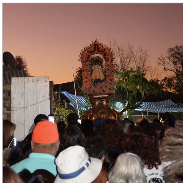
Figura 7. - Imagen en procesión al hombro de personas voluntarias, rodeada de los tradicionales bailes religiosos y el peregrinaje reunido durante su Fiesta Grande del año 2023.

Desde ayer se han trasladado a la vecina villa de Sotaquí, innumerables peregrinos con motivo de la Fiesta del Niño. Estos peregrinos, contra la voluntad del Alcalde, bailarán cuecas, tomarán tragos —cortos y largos— y a muchos se les «pasará la mano» con el «tinto», para rendir un homenaje al niño milagroso. Cuentan que, hay más de cien «promesas» que consisten en tomarse cinco litros de Vino de Samo Alto, en el reducido espacio de una hora; debiendo quedar, después, en condiciones de llegar hasta el Niño por sus propios pies, desde dos cuadras de distancia. Ojalá no haya ningún extranjero observador por aquellos lados para que no se lleve la impresión que es de imaginarse, después que vea a los «promeseros» criollos. ( Diario El Regional 1945)